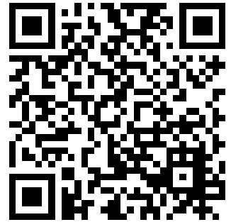
ABB - ABB SYSTEEMPROFIEL