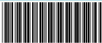
ABB - ABB TERMINAL BLOCK PE