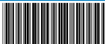
ABB - ABB MONTAGEKIT MET SLEUF